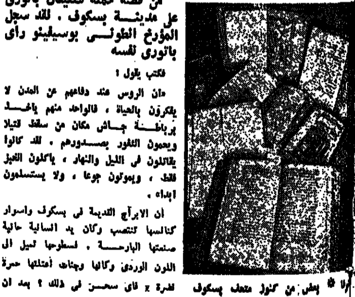
ابناء من منزل مختلف بسكراف

ويقيم المليون من المياه مساهمة جمة الرعاء. لقد اكتشفوا احتياطات كبيرة المياه الجوفية في اوزبكستان. في الجمهورية البروم حوالي خمسة الاف الفوردية وهي ثروة المياه. ٢٥٠ الف الفوردية، ويضع جزء منها في محافظة نوروت بنا، وسط الصحراء، وهاجعت واحة اخرى حيث تفيض المياه الجوفية من ٢٥-٣٥ مترا، ويكبية كبيرة لغرفة الرعاء قروا استعدادها لرق السكان